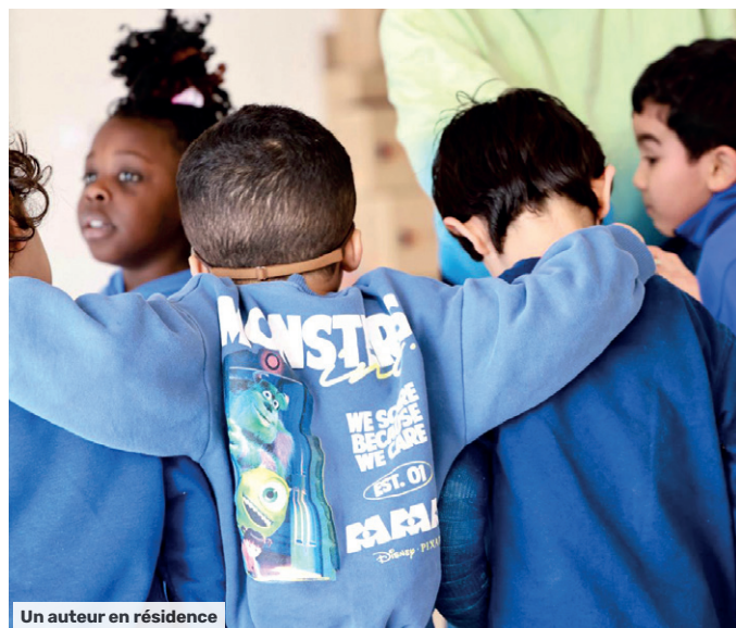
Un auteur en résidence

De cette rencontre est né « L'envol, l'envol », œuvre immersive, participative et collaborative, film documentaire poétique, qui sera projeté pour les élèves et leurs parents à l'occasion de la Fête de quartier début juin.