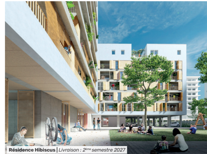
Résidence Hibiscus | Livraison : 2 ème semestre 2027

Actuellement en chantier, la résidence Hibiscus verra le jour au second semestre 2027.