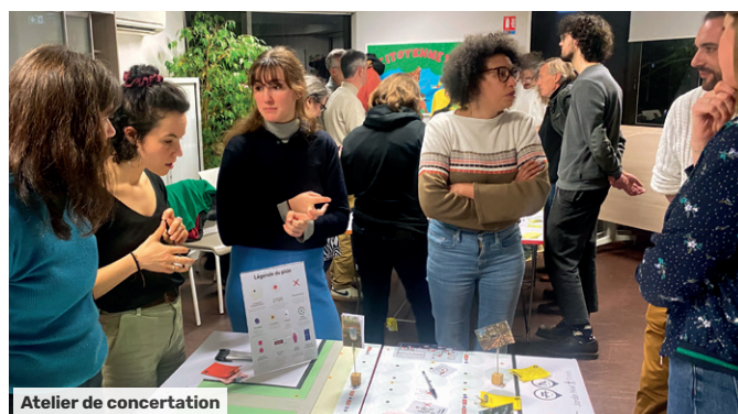
Atelier de concertation